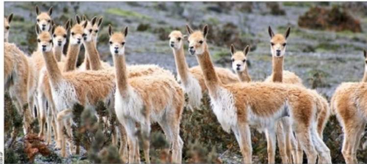
En Chile el 97% de las vicuñas habita en áreas protegidas de la Región de Arica y Parinacota (como el Parque Nacional Lauca y la Reserva Las Vicuñas). El 3% restante se distribuye entre las regiones de Tarapacá, Antofagasta y Atacama.

Un metro de tela 100% de vicuña vale $28 millones en la fábrica escocesa Holland & Sherry. Un abrigo como este de Ermengildo Zegna, puede costar $15 millones.